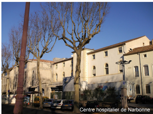
Centre hospitalier de Narbonne

En facilitant le transfert d'images médicales, le très haut débit pourrait demain améliorer la prise en charge des malades, y compris dans les petites unités de soins. En attendant de voir les villes à la campagne, le THD c'est la médecine de ville, même à la campagne !